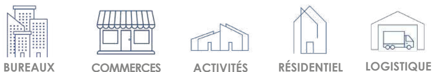
Allocation par typologie d'actifs selon quote part de détention

• Un Fonds détenant un portefeuille d'actifs aux typologies diversifiées.